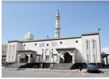
مجمع الثميري القرآني بالحلقة الشرقية