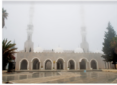
مجمع الملك فهد القرآني بالهدا