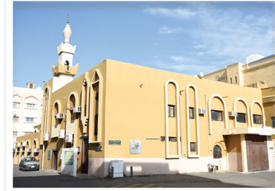
مجمع عبدالله بن الزبير القرآني بحي شبرا